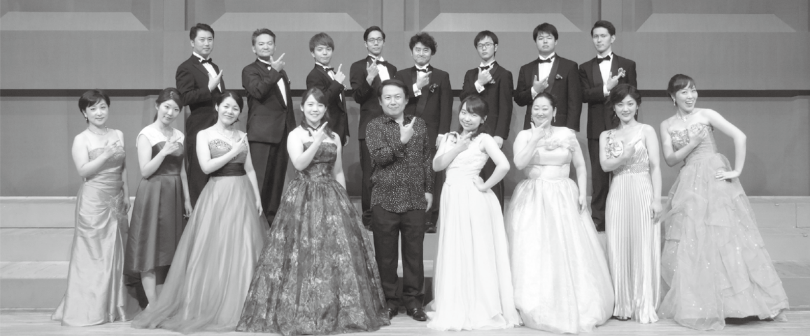
※出演メンバーや人数は写真とは異なる場合がありますので予めご了承ください。