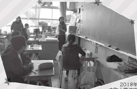
2018年、東京都小金井市立本町小学校でのワークショップにて