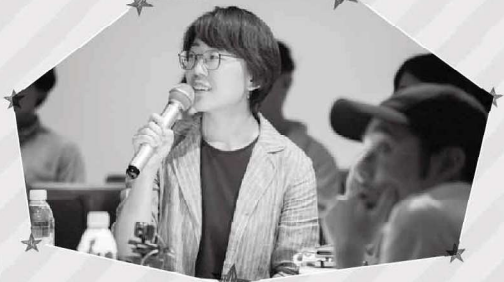
2019年、六本木AXISギャラリーでのディスカッションイベントにて