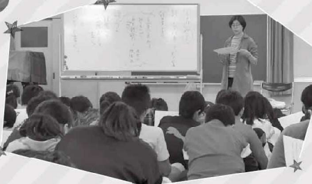
2018年、東京都小金井市立本町小学校でのワークショップにて