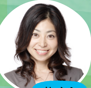
ナレーション 岡村 明美