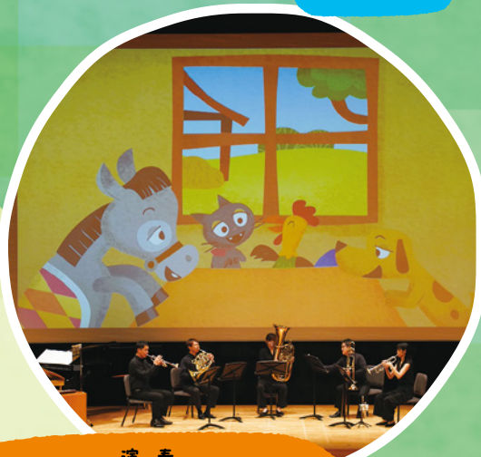
演奏 トラベル・プラス・クインテット+